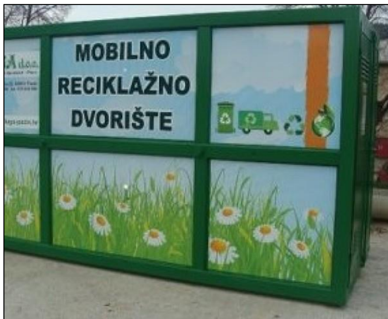
Slika 3. Mobilno reciklažno dvorište

Mobilno reciklažno zatvoreno je nakon otvaranja novog reciklažnog dvorišta u 2022. godini te se u 2023. godini nije koristilo. Slikom u nastavku prikazano je mobilno reciklažno dvorište.