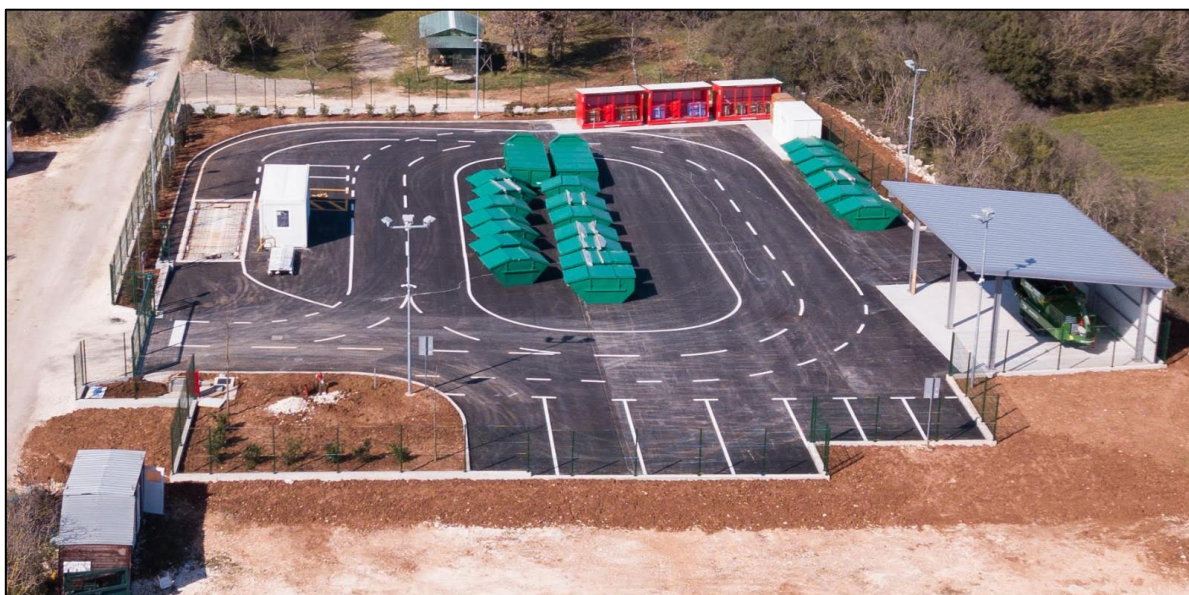
Slika 4. Reciklažno dvorište Općine Fažana

Izgled reciklažnog dvorišta za područje Općine Fažana prikazano je slikom u nastavku.