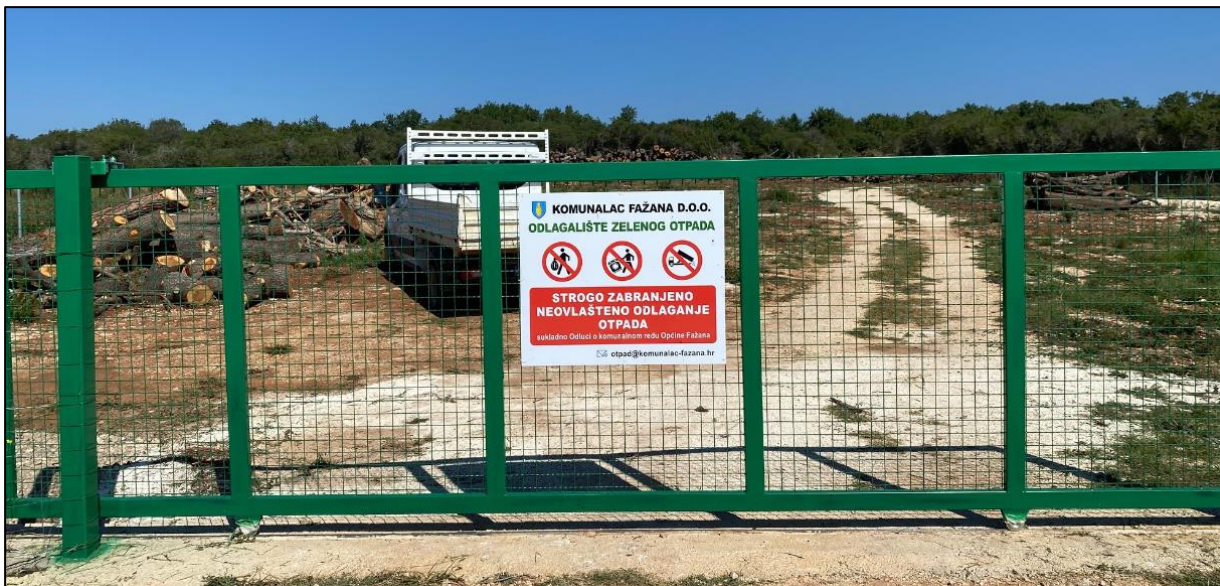
Slika 2. Privremeno odlagalište zelenog otpada

Početak rada novog reciklažnog dvorišta u 2022. godini prestalo je s radom privremeno odlagalište zelenog otpada koje se u 2023. godini nije koristilo.