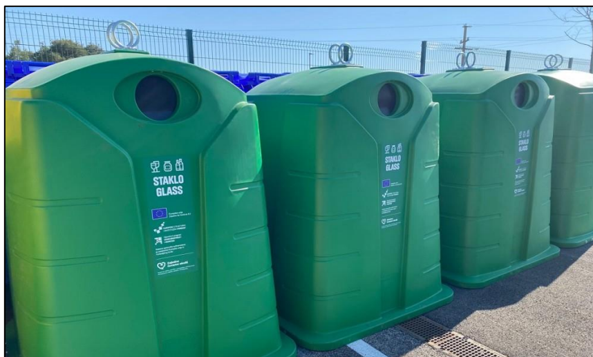
Slika 5. Spremnici za odvajanje otpadnog stakla