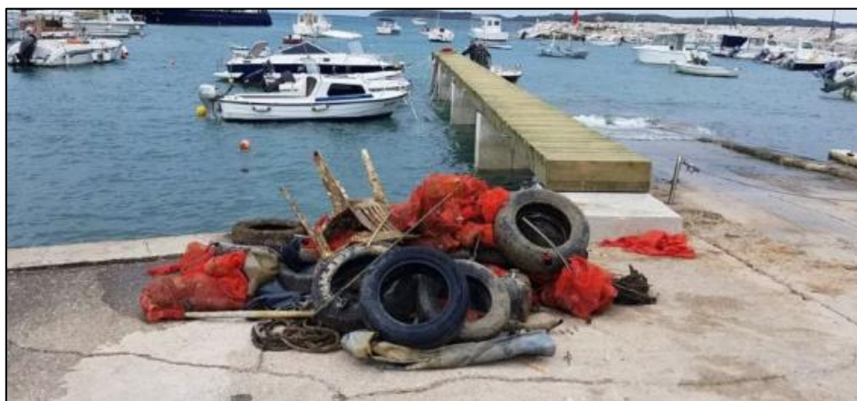
Slika 6. Ekološka akcija čišćenja podmorja i priobalja fažanskog kanala

20. 05. 2023. godine je od strane PŠRD Sardela, Centra za podvodne aktivnosti Pula, Lučke uprava, Jedriličarskog kluba Brioni Fažana, Komunalca Fažana, Općine Fažana i Turističke Zajednice Općine Fažana organizirana 8. ekološka akcija čišćenja podmorja i priobalja fažanskog kanala (akvatorij od fažanskog lukobrana do kupališta Dječjeg igrališta podijeljen u 3 zone čišćenja). Akciji se pridružila i Eko patrola Dječjeg vrtića Sunce iz Fažane. Djeca su koordinirano s djelatnikom Lučke uprave čistila fažanski lukobran. Drugo čišćenje akvatorija fažanske luke održano je 23. 09. 2023. godine u organizaciji PŠRD Sardela, Centra za podvodne aktivnosti Pula i Turističke zajednice Općine Fažana s ciljem da se tijekom zimskog perioda otpad ne raznese na šire područje. Prikupljena je veća količina sitnog otpada (jednokratna plastika, staklene bo, vrećice ...) koncentriranog u krugu od 200 m od polaznog mola u Fažani, kojeg putnici s brodova bacaju u more.