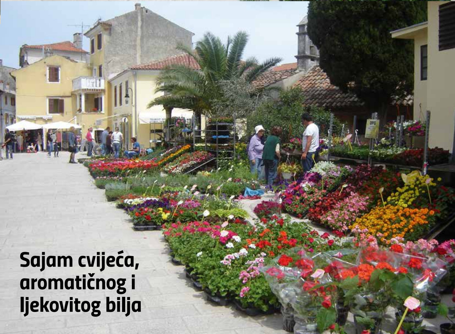
Sajam cvijeća, aromatičnog i ljekovitog bilja