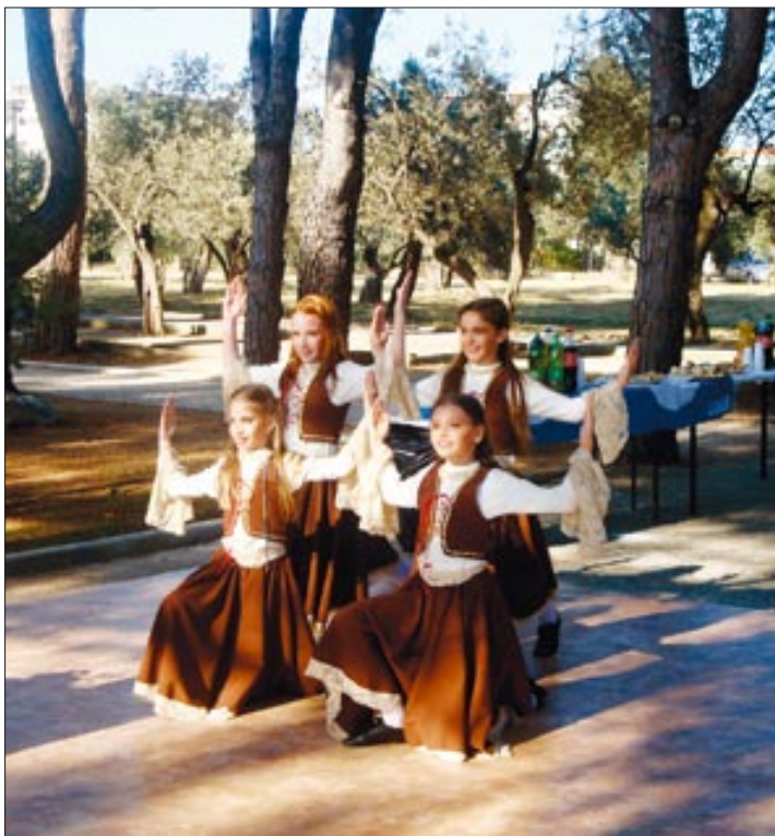
Društvo naša djeca na podizanju "Plave zastave"