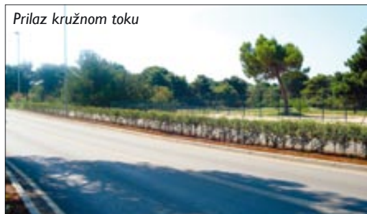
Prilaz kružnom toku

šinama Fažane jug II, ali zbog nezadovoljstva okolnih stanara i svakodnevnih opstrukcija, nije zaživjelo na zamišljen način.