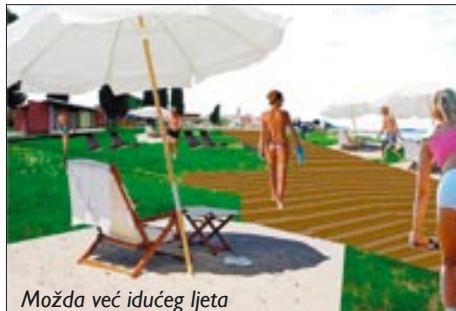
Možda već idućeg ljeta

Idejni projekt najduže plaže u Istri, koja bi trebala obuhvatiti 2,7 kilometara fažanskog priobalja, predstavljen je 20. listopada i Općinskom vijeću. S pažnjom su vijećnici saslušali i odgledali prezentaciju Vladimira Filipovića, po čijim riječima već ima zainteresiranih poduzetnika za uključenje u projekt, koji bi mogao zaživjeti od naredne sezone. Vijećničke dileme otklonio je pojašnjenjem da će pristup zamišljenoj plaži mještanima biti besplatan, da uređenje najsuvremenije plaže