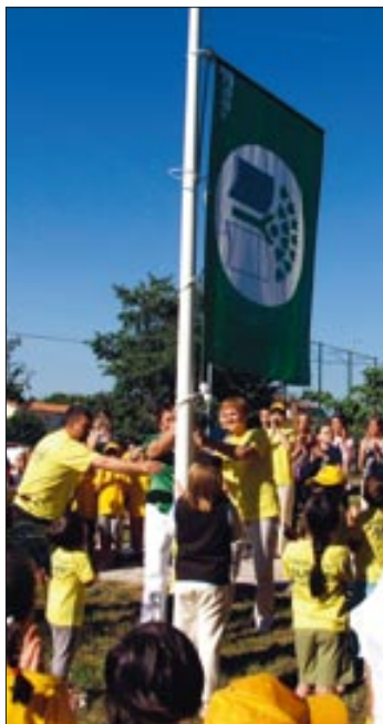
Podizanje "Zelene zastave"

Inače, postojeće odgojno-obrazovne grupe formirane su po starim standardima, a Hrvatski sabor je 16. svibnja 2008. donio državne pedagoške stan-