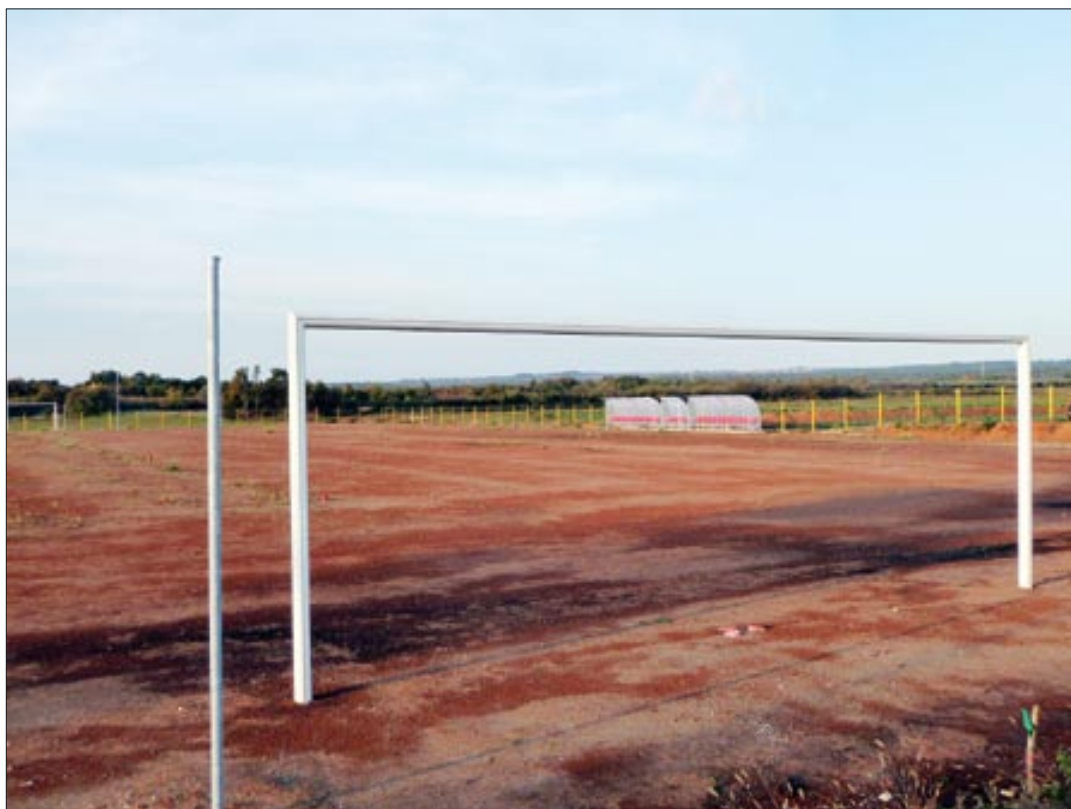
Malerozno valbandonsko igralište

- Imat ćemo uskoro skupštinu, upoznati se s teškom situacijom, bez obzira što rezultatski dobro stojimo. U vrhu smo Četvrte hrvatske nogometne lige, drugi smo na tabeli, nikad nismo bili tako visoko, ali kako ćemo izgurati do kraja, teško je reći. Uglavnom, sve kategorije nam rade dobro, svima smo zadovoljni. Ali troškovi su tu, nenamirene obveze... Treba putovati na susrete, platiti suce, autobuse i ostale troškove, a puno od toga do sada nije plaćeno. U minusu smo i sreća je što nas ljudi čekaju.