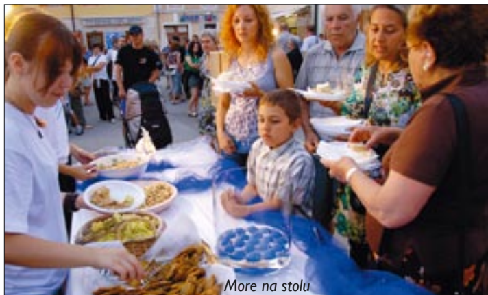
More na stolu