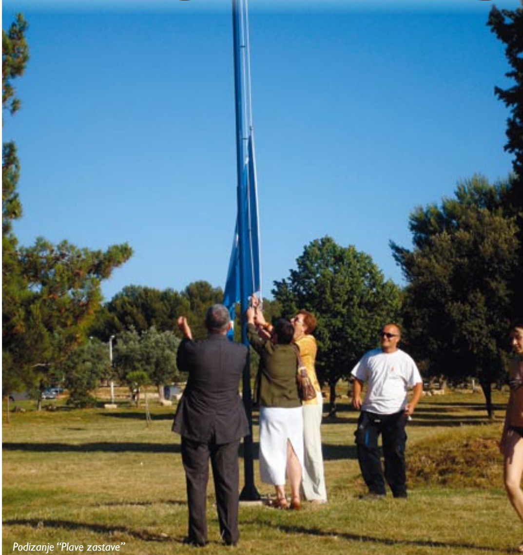
Podizanje "Plave zastave"

slike od školjaka, lavande, papira i kamenčića. Gosti na plaži, pogotovo strani, bili su vrlo zadovoljni održanom radionicom, žaleći što takve aktivnosti za djecu nisu češće.