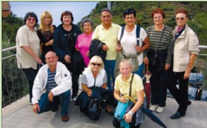
Al Parco Nazionale delle Cinque Terre