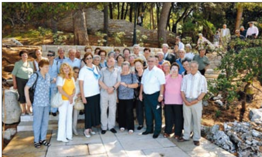
Brijunski umirovljenici s predsjednikom Mesićem 30.6.09.