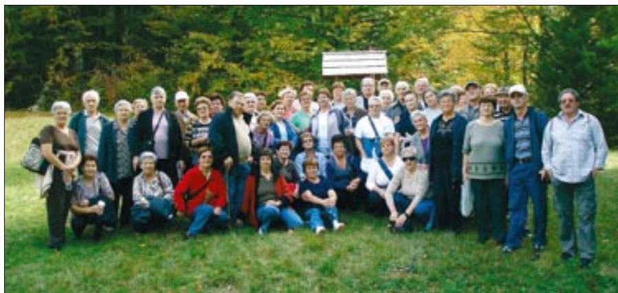
Umirovljenici u NP Risnjak 10.10.09.

čekalo lijepo sunčano vrijeme. Područje masiva Risnjak proglašeno je nacionalnim parkom 1953. godine zahvaljujući tome