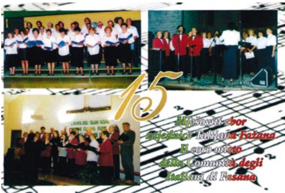
Zbor Zajednice Talijana

Planovi za budućnost? Prioritetan nam je vrtić, a jednog dana možda i škola.