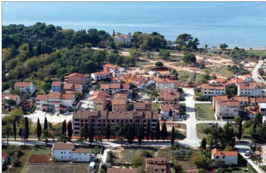
Predio Fažana-jug II

putovanja (45.000) i izgradnju i rekonstrukciju fekalne kanalizacije (1.049.180 kuna).