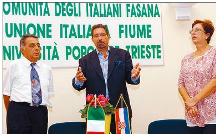
Talijanski konzul u Fažani

Inače, u talijanskom odjeljenju fažanskog Dječjeg vrtića Sunce trenutno je 25 djece, a još je 40 zahtjeva za upis u vrtić na talijanskom jeziku.