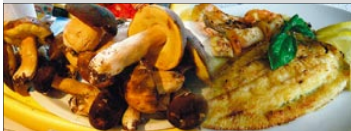
Dio ponude prve posezonske gastro manifestacije

U svojim objektima na Titovoj rivi istodobno su razna jela od švoja ponudile konobe Riva i Vasanum te restoran Plavi. Uz jela, posjetitelji su na Trgu, dok su ih zabavljali harmonikaši i mađioničar, mogli degustirati i tipične istarske proizvode: pršut, sir, vino i mlado maslinovo ulje.