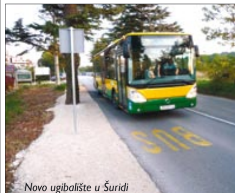
Novo ugibalište u Šuridi

Nakon što su uplatom dijela duga „Pulaporometu“ zadržane postojeće autobusne linije između Fažane i Pule, Općina Fažana pobrinula se i za