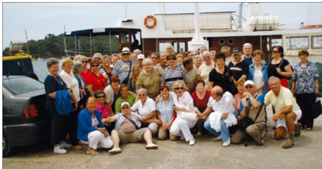
Fažanski umirovljenici u Vrsaru 28.6.09.

Dok je u Fažani pljuštala kiša, 10. rujna umirovljenički autobus zaputio se na jednodnevni izlet u Nacionalni park Risnjak, gdje nas je do-