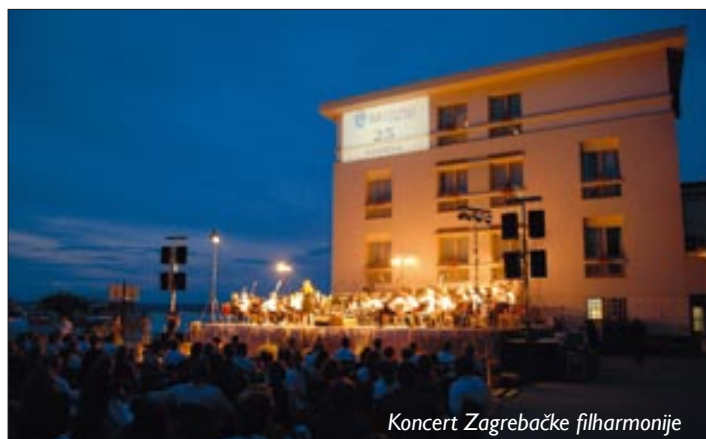
Koncert Zagrebačke filharmonije

U proteklih 25 godina Nacionalni park posjetilo je više od tri i pol milijuna izletnika i ostvareno je oko milijun noćenja. Organizirani su brojni skupovi od OPEC-a do medicinskih, ekonomskih i drugih stručnih kongresa, godišnjih konferencija poznatih domaćih i stranih tvrtki i raznih događanja poput polo i golf turnira, svečanih večera na otvorenom. Brijuni su svojom jedinstvenom ponudom privukli i ugostili veliki broj poznatih osoba: Naomi Campbell i Slavicu Ecclestone, princezu Carolinu od Monaca sa suprugom Ernstom Augustom od Hannovera , princa Vittorija Emanuelea III. , kralja Abdullaha Aziza , jordanSKU princezu Firyal , princezu i princa od Kenta, književnicu Eve Ensler , glumca Johna Malkovicha , španjolskog tenora Placida Dominga , hollywoodskog producenta Jacka Valenta , pisca Paula Koelha, češkog redatelja nobelovca Jiri Menzela i mnoge druge .