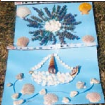
Projektni dan 2009.