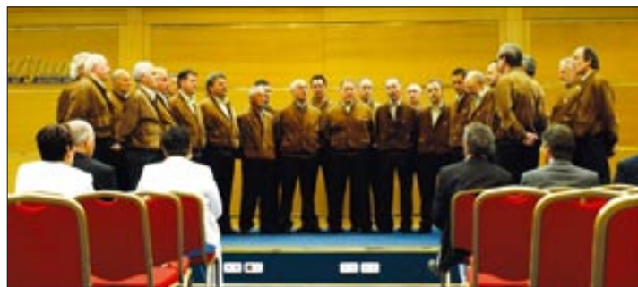
stupili su gostujući Coro Sasso Rosso i pulske Teranke.

Tim povodom upriličena je gastro prezentacija proizvoda regije Trento i tipičnih istarskih proizvoda brijunskog zaleđa, uz nastup folkloru Zajednice Talijana Bale. Istom prigodom na-