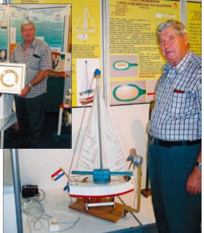
Piton s modelom jedrilice na ovogodišnjem Obrtničkom sajmu u Puli

Peti izum, „Univerzalni brodski siz sa stepenicama koje se okreću na obje strane pod kutem od 45 stupnjeva“, prijavio je 2007. i na izložbama inovacija ARCA-2007 u Zagrebu i NATUTICA-2007 u Rijeci dobio je