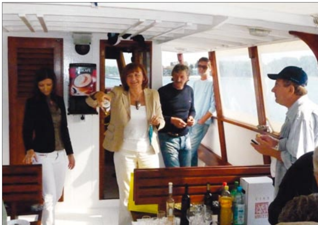
Ocjena sezone i najava posezone na brodu

Gosti koji su ostvarili najveći broj noćenja u tim kapaciteti-