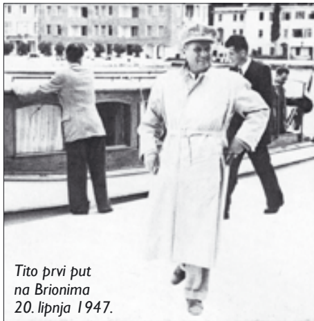
Tito prvi put na Brionima 20. lipnja 1947.

Iako je pored Briona plovio 1939. godine na putu prema Trstu, Tito je prvi put na otočje došao preko Fažane 20. lipnja 1947. Iz Opatije je, naime, krenuo automobilom preko Labina i u Marčani je kolona skrenula bijelom cestom prema Vodnjanu i Fažani, jer je Pula još bila pod anglo-američkom vojnom upravom. Iz Fažane preko kanala nastavili su motornim čamcem i pristali ispred hotela „Karmen“, o čemu svjedoče sačuvane dvije fotografije, jer je pristanište s hotelskim kompleksom „Naptun“ bilo bombardirano. Tamo su Tita