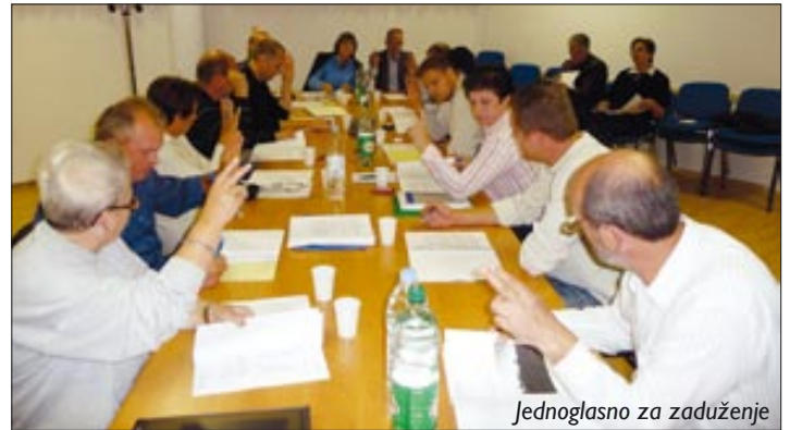
Jednoglasno za zaduženje

Ovlašteni predstavnici Općine Fažana utvrdili su da je najpovoljnija ponuda Privredne banke, koja 10 milijuna kuna kredita daje na pet godina (uz godinu počeka), 7,5 posto fiksnih kamata (ukupno 2.282.429,27