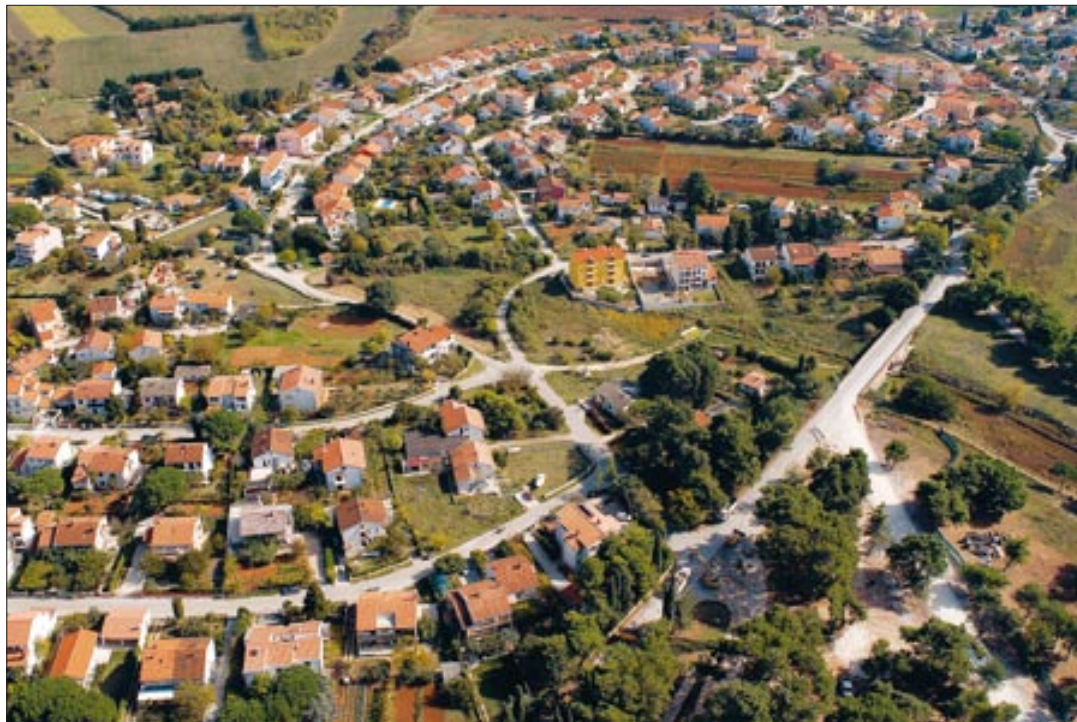
Uskoro privatni vrtić u Valbandonu

Kandidati za ovu jedinstvenu donaciju, koja će prvenstveno poslužiti za opremanje budućeg vrtića, moraju imati adekvatni prostor s idejnim projektom vrtića i osposobljenost za obavljanje poslova odgojitelja. Prijedlog odluke o donaciji za otvaranje dječjeg vrtića upućen je na prvo čitanje, a predviđenih 100.000 kuna osigurati će se rebalansom proračuna. Za provedbu postupka dodjele sredstava predloženo je poseb-