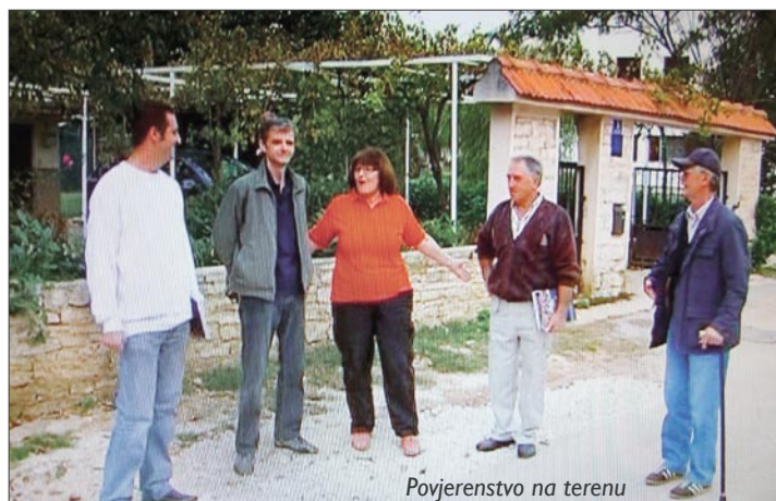
Povjerenstvo na terenu

Radi utvrđivanja nastalih šteta osnovano je Općinsko povjerenstvo za procjenu štete od elementarne nepogode na području Općine Fažana koje je sačinilo prvu procjenu i dostavilo je županu Istarske