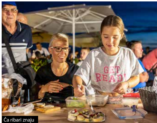
Ča ribari znaju