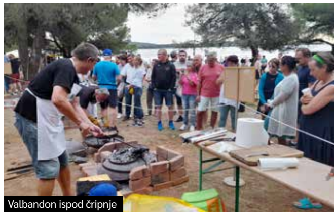
Valbandon ispod čripnje