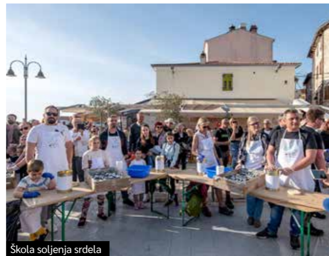
Škola soljenja srdela