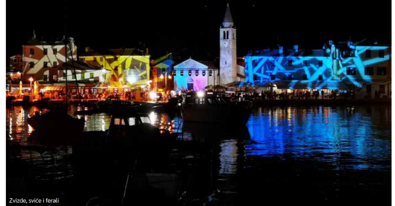
Zvizde, sviće i ferali

Fažana je mala i nužno je da zajednički definiramo hoćemo li se opredijeliti za jedan održivi model ili za masovniji turizam. Za tu odluku moramo svi sjesti za stol - i predstavnici Općine, mještani, svi turistički subjekti, turistička zajednica i odlučiti što znači koja varijanta, što želimo i kako to provoditi