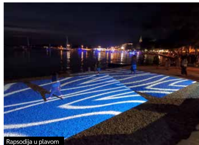
Rapsodija u plavom

Fažana je mala i nužno je da zajednički definiramo hoćemo li se opredijeliti za jedan održivi model ili za masovniji turizam. Za tu odluku moramo svi sjesti za stol - i predstavnici Općine, mještani, svi turistički subjekti, turistička zajednica i odlučiti što znači koja varijanta, što želimo i kako to provoditi