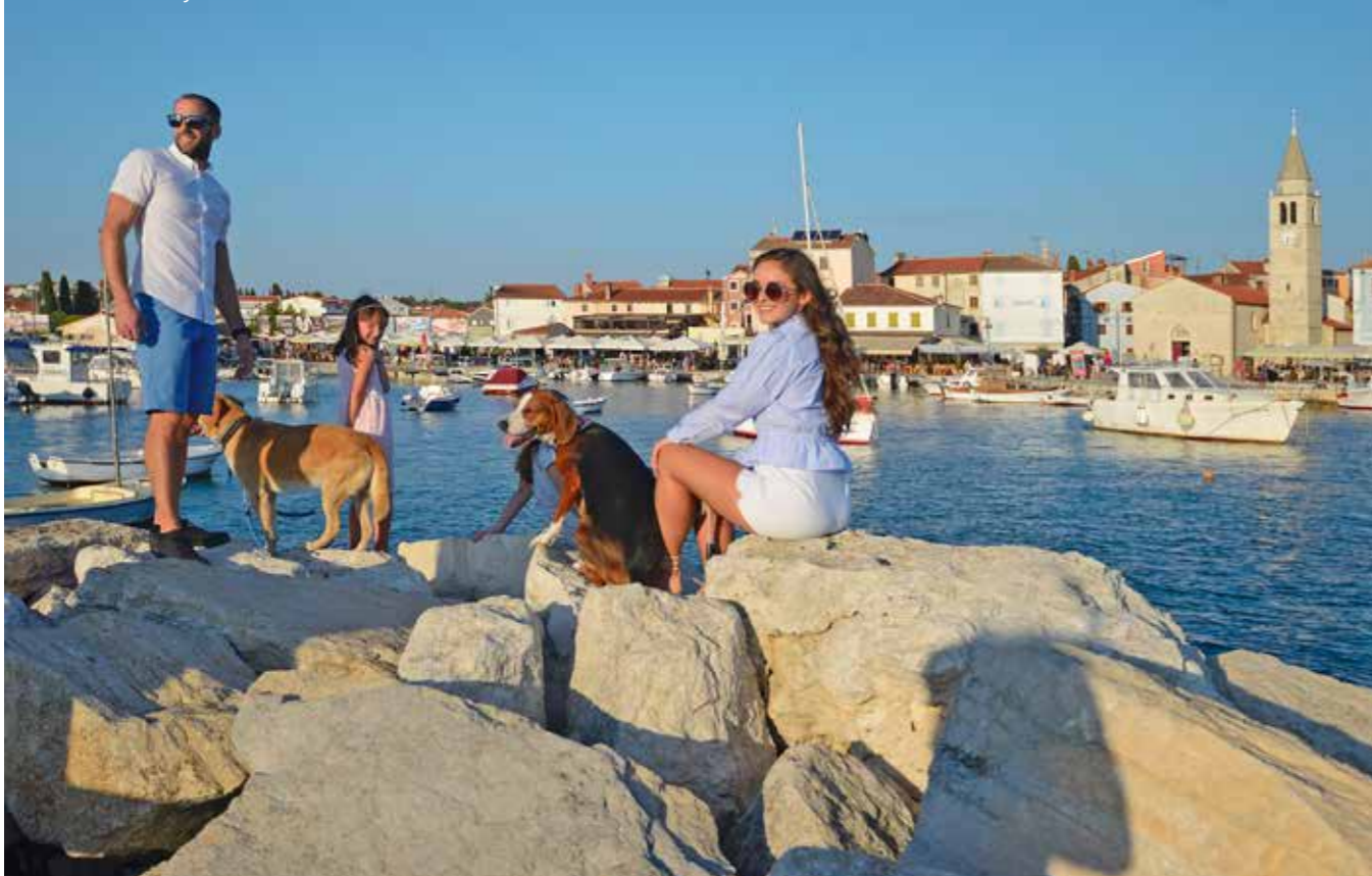
Fažana Pet Friendly

kuna, no idućih godina u taj će se projekt uložiti ukupno 450 do 500 tisuća kuna za cijelu južnu Istru. Imamo i niz drugih zajedničkih projekata poput South istra weeding, snorkeling, a nužno je revidirati i županijski plan razvoja i tematizacije te urednosti plaža. Zajedno s Općinom Fažana, na našem području, izdvojila bih, od infrastrukturnih projekata pješačko-bike stazu od Fažane sjever do Peroja te projekt Razvoj maslinarstva od Rima do danas gdje bi se kroz različite multimedijalne sadržaje obradila povijest a u prostoru maslinika kod Dječjeg igrališta organizirao bi se punkt s prodajom i degustacijom te prezentacijama Rimske vile u Valbandonu, velike tvornica za amfore. Ove godine u planu je izrada projekta nakon kojeg ćemo znati i cijenu eventualno tražiti i sufinanciranje za realizaciju tog značajnog projekta.