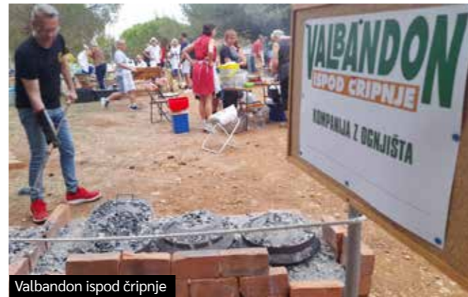
Valbandon ispod čripnje